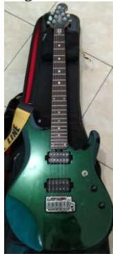
Gambar 6 Gitar

sementara proses di tengahnya melibatkan berbagai elemen modern. Konsep ini sejalan dengan pemikiran Bhabha (1994) tentang "third space" atau ruang ketiga, di mana identitas-identitas yang berbeda bertemu dan menciptakan sesuatu yang baru tanpa menghilangkan karakteristik aslinya. Teknik unison pada empat jenis alat musik (gitar, bass, keyboard, dan gangsa) memperkuat pesan persatuan, menunjukkan bahwa instrumen dari berbagai tradisi dapat bermain dalam harmoni yang sama.