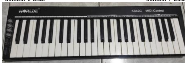
Gambar 8 Keyboard