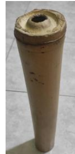
Gambar 3 Fu