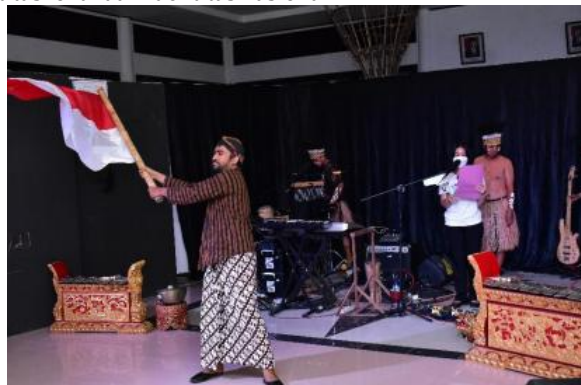
Gambar 12 Opening pentas

Penggunaan bendera merah putih sebagai simbol visual dalam karya ini juga menghadirkan ambiguitas makna dalam konteks Papua. Di satu sisi, bendera merah putih merupakan simbol resmi negara Indonesia yang merepresentasikan persatuan dan nasionalisme. Namun di sisi lain, dalam konteks Papua yang memiliki sejarah panjang konflik dengan pemerintah pusat, bendera merah putih juga dapat dibaca sebagai simbol yang kontroversial. Bagi sebagian masyarakat Papua, bendera merah putih merepresentasikan dominasi Jakarta dan penindasan terhadap aspirasi politik lokal. Dalam konteks ini, penggunaan bendera merah putih dalam karya "Pelangi Papua" dapat dibaca sebagai upaya untuk menegosiasikan identitas Papua dalam kerangka nasionalisme Indonesia, sekaligus menghadirkan ketegangan antara identitas lokal dan identitas nasional.