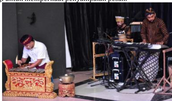
Gambar 10 Backdrop hitam

Backdrop hitam dengan wings dan lampu par LED menciptakan kanvas visual yang netral namun fleksibel untuk transformasi warna sesuai dengan narasi setiap part. Warna hitam sebagai backdrop berfungsi sebagai "layar kosong" yang memungkinkan warna-warna lighting (biru muda, biru tua, merah, putih) untuk tampil dengan maksimal tanpa gangguan visual. Penggunaan teknologi lighting modern (par LED) menunjukkan bahwa meskipun karya ini mengeksplorasi tradisi, ia tidak anti-teknologi melainkan memanfaatkan teknologi untuk memperkuat penyampaian pesan.