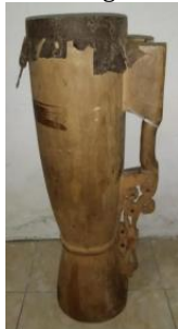
Gambar 2 Tifa

Part 2 menghadirkan eksplorasi budaya Papua melalui instrumen tradisional tifa, pikon, dan fu dengan tempo yang lebih cepat ( Allegro , ♩ = 126). Yang menarik adalah kolaborasi antara instrumen tradisional dengan Electro Dance Music (EDM) sebagai background . Pendekatan ini sejalan dengan konsep "globalization" yang dikemukakan oleh Robertson (1995), di mana elemen lokal dan global tidak dipandang sebagai oposisi biner melainkan sebagai entitas yang dapat berpadu menciptakan identitas musikal yang unik. Fusion antara tifa Papua dengan EDM menciptakan ruang musikal yang melampaui dikotomi tradisi-modernitas, menunjukkan bahwa tradisi tidak harus statis dan dapat beradaptasi dengan konteks kontemporer tanpa kehilangan esensinya.