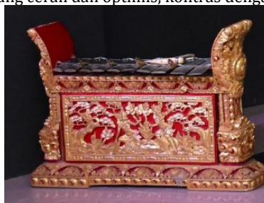
Gambar 5 Gangsra

Part 4 sebagai klimaks menghadirkan resolusi melalui kolaborasi instrumen Bali (gangsra) dengan instrumen modern. Kehadiran gangsra Bali dalam karya yang bertema Papua menunjukkan bahwa resolusi konflik di Papua tidak hanya melibatkan masyarakat Papua sendiri, tetapi juga solidaritas dari berbagai elemen bangsa Indonesia. Penggunaan tempo Animato (♩ = 120) dengan tangga nada berlaras pelog pentatonis menciptakan nuansa yang cerah dan optimis, kontras dengan Part 3 yang gelap dan tegang.