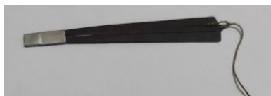
Gambar 4 Pikon

Teknik unison dan battle (bergantian) pada alat musik tifa menciptakan dialog ritmis yang kompleks namun tetap harmonis. Dialog ini dapat dibaca sebagai representasi musikal dari keberagaman suku di Papua yang memiliki karakteristik berbeda namun dapat hidup berdampingan secara harmonis. Ritme yang energik dan dinamis pada bagian ini menciptakan kontras dengan Part 1 yang lebih kontemplatif, menunjukkan bahwa harmoni tidak selalu berarti ketenangan, tetapi juga dapat berupa dinamika yang penuh energi.