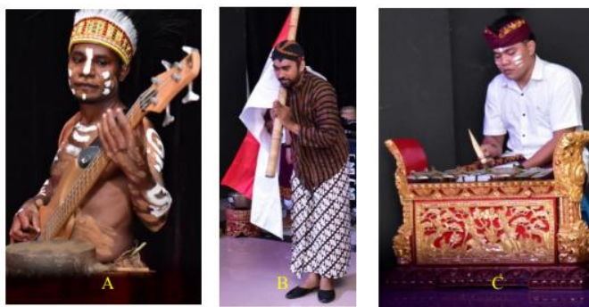
Gambar 9 Kostum. A kostum Papua, B kostum Jawa, dan C kostum Bali

utama. Kehadiran kostum Bali dan Jawa menunjukkan solidaritas dan persatuan dari berbagai elemen bangsa Indonesia.