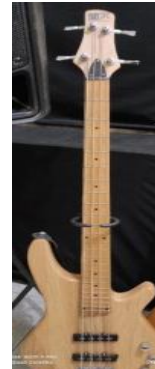
Gambar 7 Bass